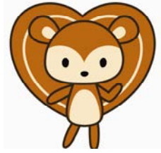
キャラクター[まもりす]

地盤保証制度は、登録地盤会社の皆様が、まもりすまい保険の届出事業者の皆様に対して行う「地盤保証」を保険でサポートするしくみです。住宅保証機構が、引受保険会社と保険契約（地盤にかかる生産物賠償責任保険）を結び、地盤調査または地盤補強工事の瑕疵により、住宅が不同沈下した場合、登録地盤会社に補修費用の一定割合を保険金としてお支払いします。