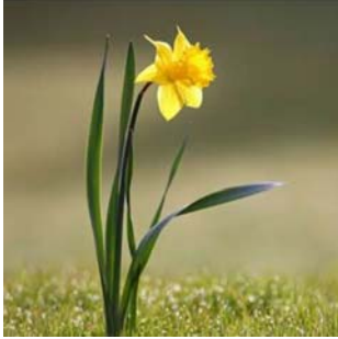
「らっぱ水仙」 花言葉：再生、復活、再出発