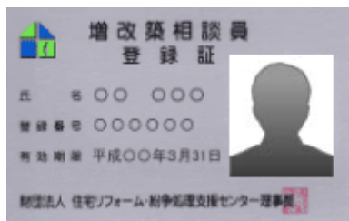
増改築相談員登録カード (顔写真入り免許証タイプ)